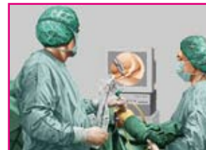
■ Abb. 5: Operationsteam

Die arthroskopische Optik besteht aus einem Linsensystem, einer Lichtquelle und einem Lichtleitkabel. Videokameras in kleinster Ausführung mit weniger als 30 g Gewicht schaffen die Möglichkeit, das Innere eines Gelenkes aufzunehmen und über einen Bildschirm vergrößert wiederzugeben. Der Operateur arbeitet mit Blick auf den Monitor