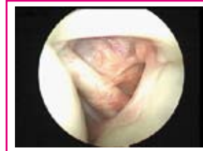
■ Abb. 4: Blick in das Schulterhauptgelenk