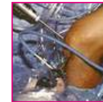
■ Abb. 6: Knie mit Arthroskop, Spülschlauch und Motorinstrument

Normalerweise ist der Gelenkinnenraum zwischen Gelenkkapsel und den knöchernen Strukturen nur ein schmaler Spalt. Er bietet somit wenig Platz für die Untersuchung und den operativen Eingriff. Für die Arthroskopie wird deshalb das Gelenk mit steriler Flüssigkeit (z.B. Kochsalzlösung) aufgefüllt. Dies erlaubt eine gute Sicht auf die einzelnen Gelenkstrukturen (Abb. 6).